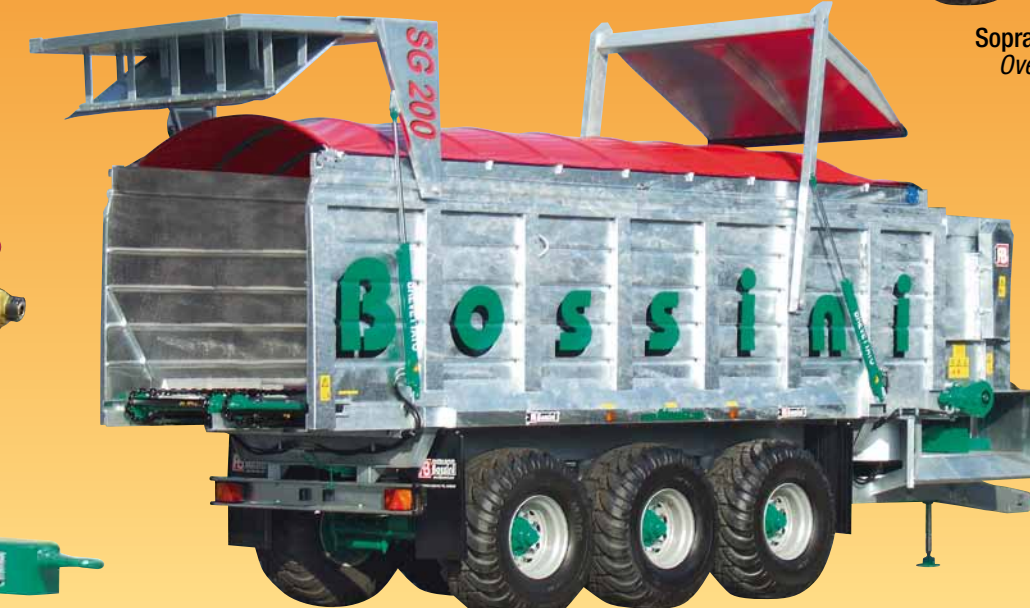
Sponda idraulica per scarico posteriore Rear hydraulic door for unload