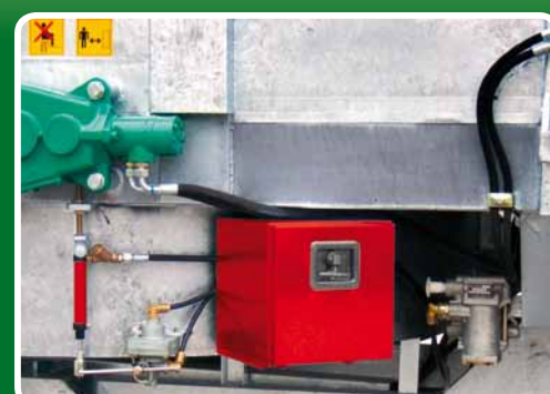
Modulatore di frenata idraulico Hydraulic braking modulator