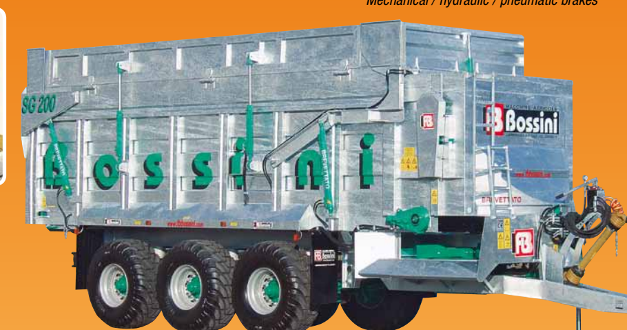
Soprasponde per materiali voluminosi (40m³) Over side for voluminous materials (40m³)