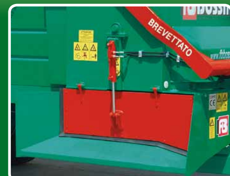
Chiusura idraulica laterale per contenimento Hydraulic closure lateral containment