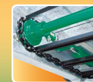
Tendicatena idraulico Hydraulic tensioner