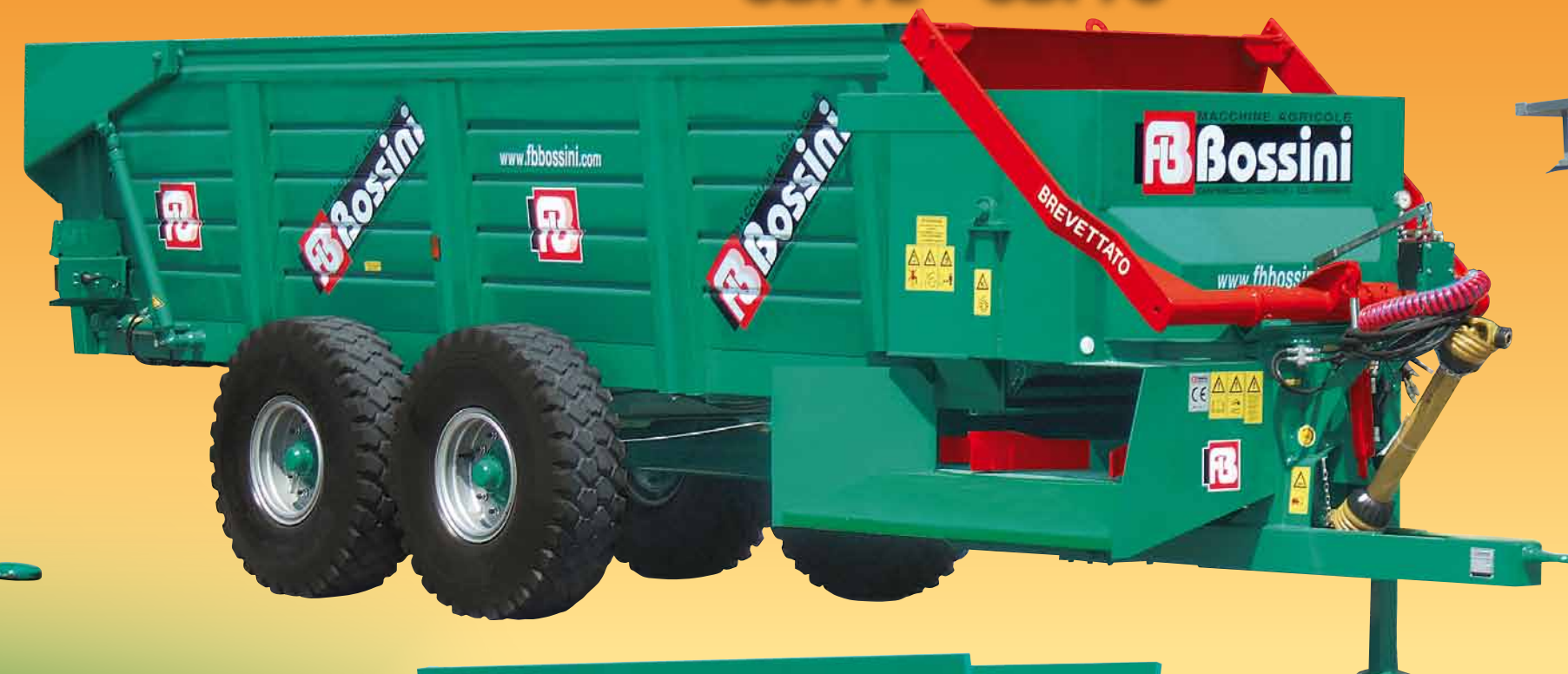
SBP/L - SBP/C