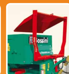
Paratoia idraulica Hydraulic door