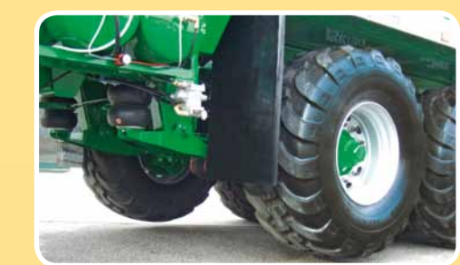
Sistema di sollevamento dell'asse Lift axle system