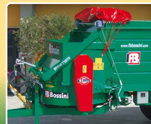
Copertura in PVC ad apertura anteriore o posteriore a comando manuale o in cabina PVC cover to open in the front or rear with manual or in the cabin control