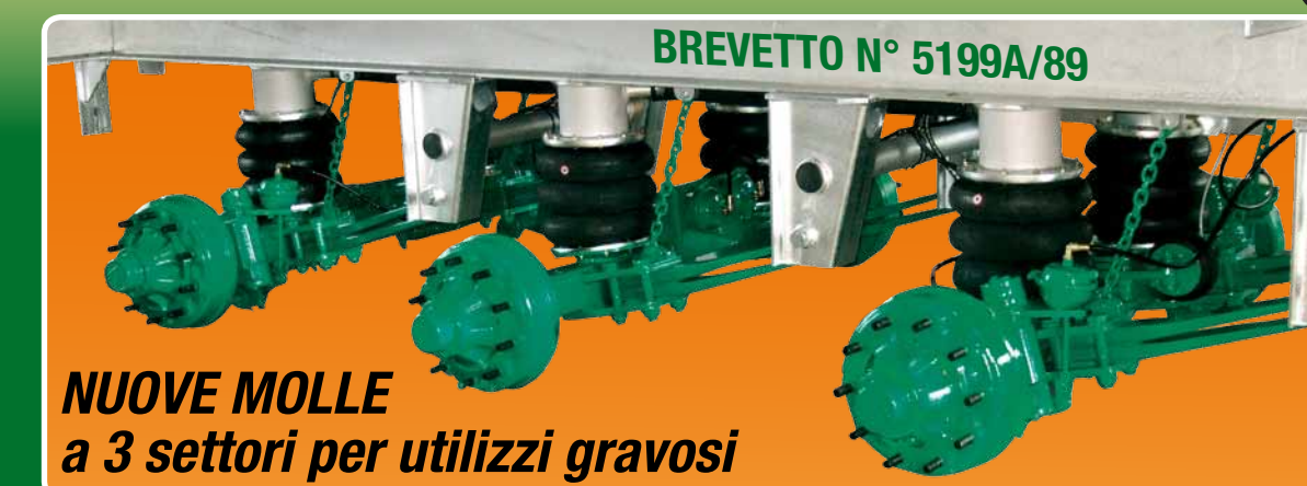
BREVETTO N° 5199A/89