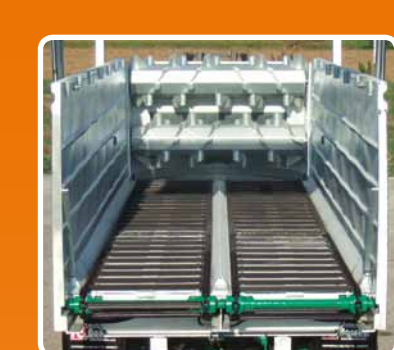
Doppio rullo per sponda maggiorata Double beaters for increased side