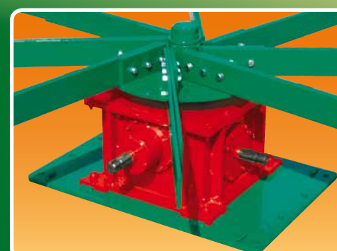
Riduttore progettato per alte prestazioni Gearbox designed for high performance