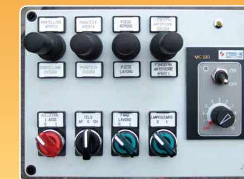
Comandi elettroidraulici con regolatore della velocità del tappeto Electro-hydraulic controls with floor speed controller