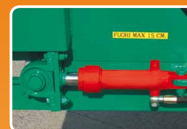
Tendicatena idraulico Hydraulic tensioner