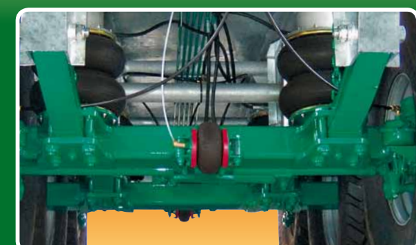
Correttore pneumatico di sterzata Pneumatic tire steering correction