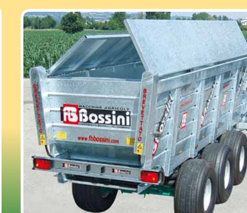
Chiusura superiore idraulica girevole a 270° Top closure hydraulic swivel 270°