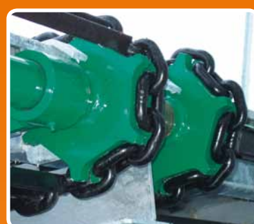
Catene speciali al nichel-cromo anti-usura e anti-stiramento Special nickel-chrome chains without wear and without stretching